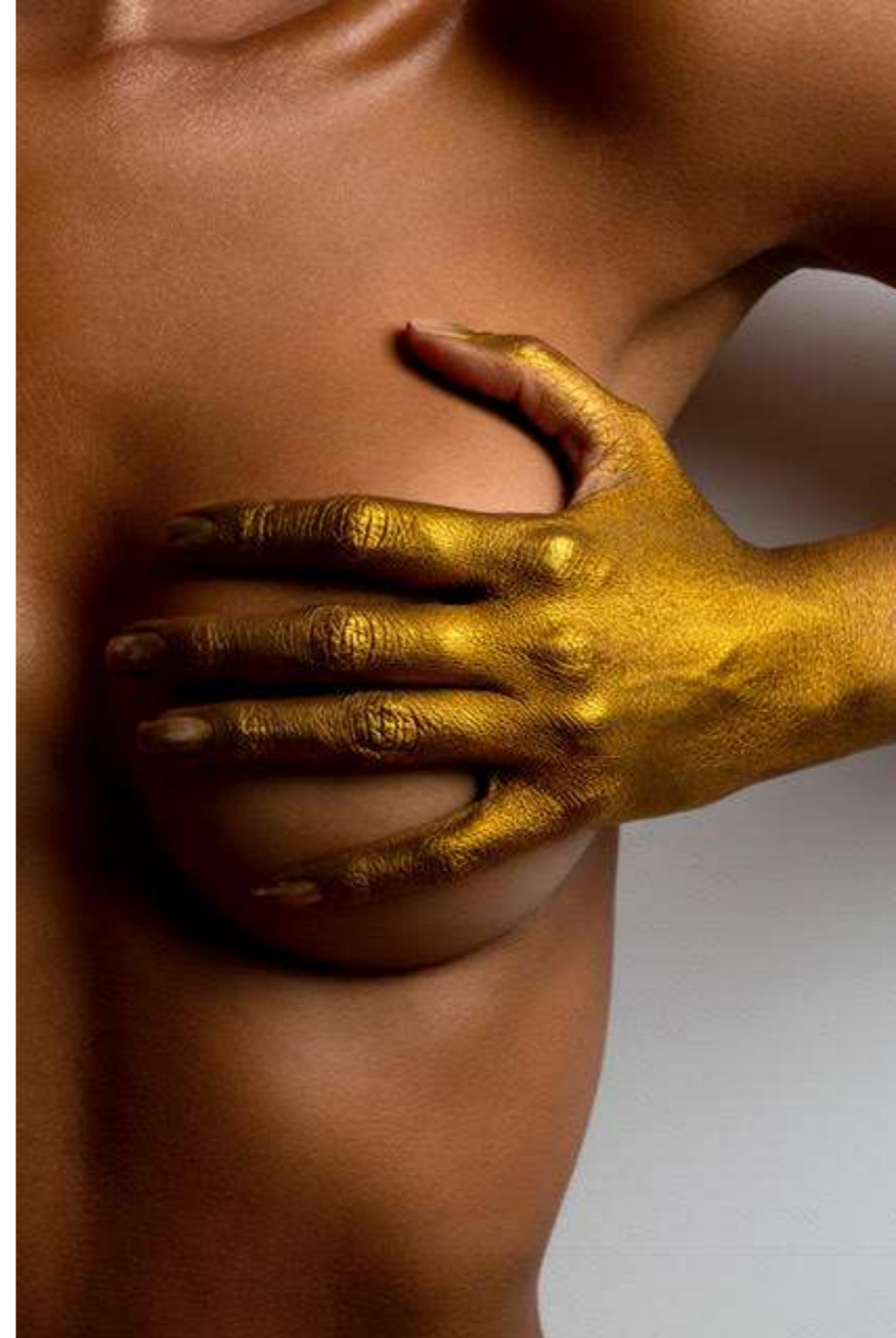
TITULO: "AURUM" AUTORA: MJOSE PUCHE TAMAÑO : 70 X 105 SOPORTE : PAPEL FOTOGRÁFICO

2013 – 2014 proyecto come-come expuesto en Murcia y en salón Venus, Alhama. 2017. "Centro de imagen Venus", proyecto compuesto de 12 retratos, inspirado sobre el estudio realizado por el fotógrafo Phillippe Halsman. 2017. "Loft 113", Proyecto compuesto de 12 retratos, inspirado sobre el estudio realizado por el fotógrafo Phillippe Halsman