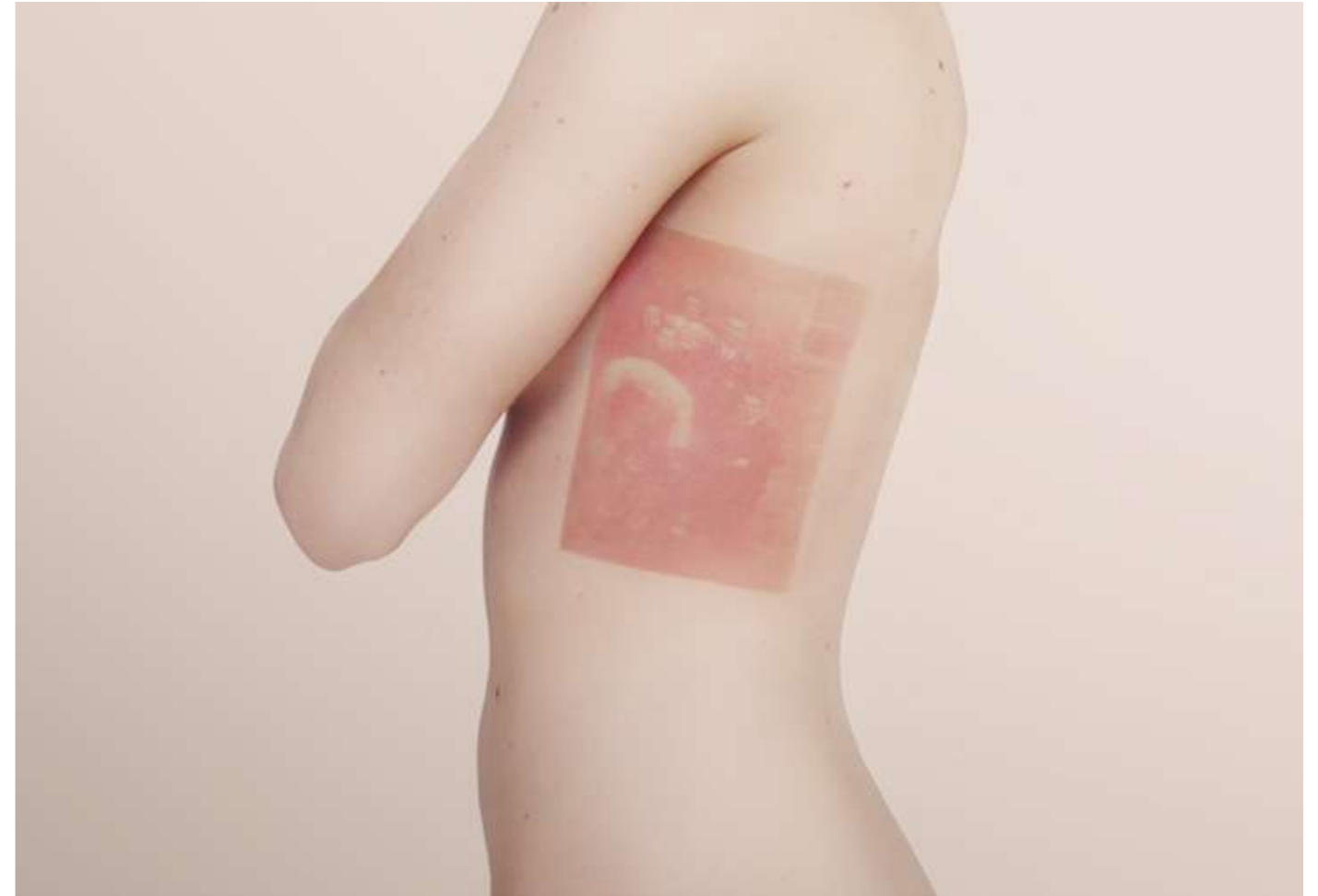
Encarnado III, de la serie “Encarnados”, 2015-2017. Quemadura sobre la piel.