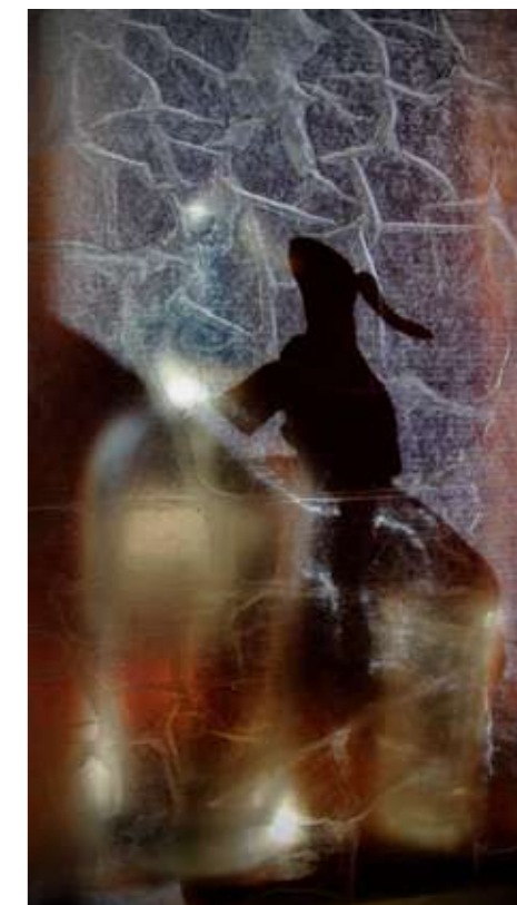
1, 2 y 3. Escenografía construida sin editor de gráficos. Positivado Lambda. 50 x 50 cms. 4, 5 y 6. Escenografía construida sin editor de gráficos. Positivado Lambda. 70 x 40 cms.